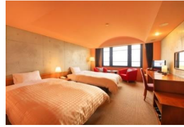
■スタンダードツインルーム 面積:28㎡ 定員3名

＜共通客室備品＞ 全室バストイレ・全室シャワー、冷暖房空調システム、テレビ、温水便座、冷蔵庫(空)、ヘアードライヤー、無料Wi-Fi、歯ブラシ