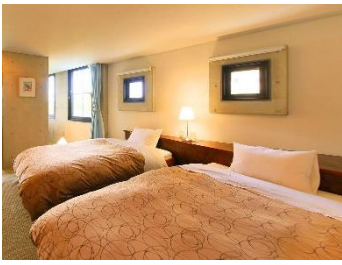
■モダン和洋室 面積:48㎡ 定員5名 セミダブルベッド 2台