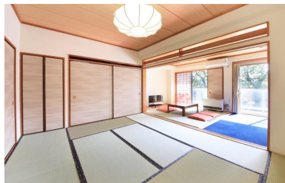
2間続きの広々とした和室

仲間と鍋パーティ、人気のレストランでの外食など、楽しみ方はお客様次第。食事に縛られない旅館ステイをご提案いたします。どうぞ自由なスタイルで箱根の温泉をお楽しみ下さい。