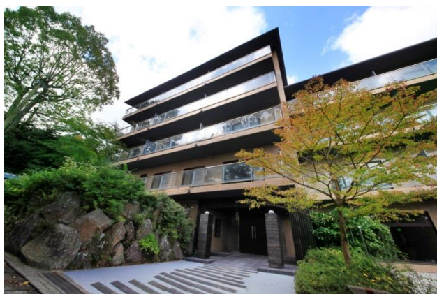
ゆとりろ庵 ANNEX 外観

箱根強羅の温泉施設【ゆとりろ庵 ANNEX(あねっくす)】(所在地：神奈川県足柄下郡箱根町強羅 1300-126)