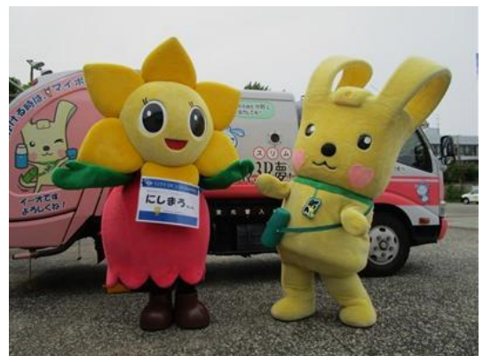
西区マスコットキャラクター 「にしまるちゃん」 「ヨコハマ3R夢！」マスコット イーオ