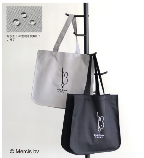
Dick Bruna TABLE 刺しゅうバッグ▶ 〈ブラック/グレー〉 3,740円（税込）

雨の日にお出かけしたくなっちゃう撥水バッグ！正面に大きくDick Bruna TABLEのロゴ刺しゅうが入ったデザインのトートバッグ。 両サイドにポケット付きなので、便利。 内側は、ポケットがひとつとボトル類を立てて収納できるループが両サイドに付いています。 生地は撥水加工のシンプルなモノトーンカラー。日々の買い物にも活躍します。