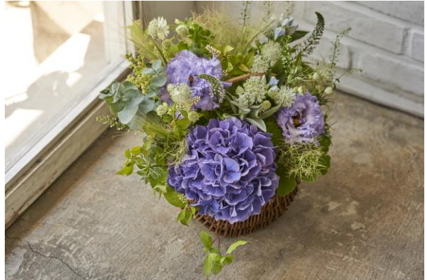
▲アジサイを使ったシャンペトルアレンジメント 8,800円（税込）