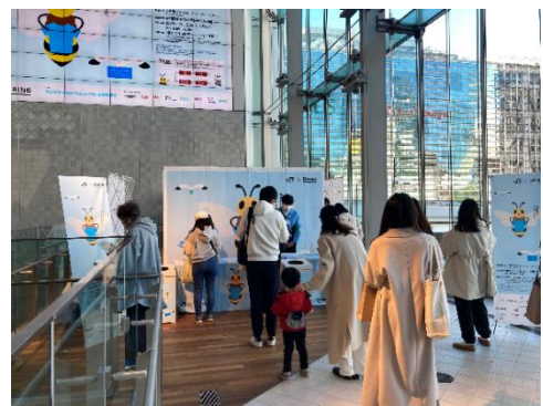
不用衣類の回収キャンペーン 過去の様子

※1: お一人さま最大2着までお持ち込み可(クーポンはお一人さま最大2枚までの配布)。