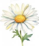
カモミール (カミツレ花エキス)