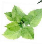
ペパーミント (セイヨウハッカ葉エキス)