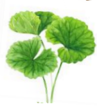
ツボクサ (ツボクサエキス)