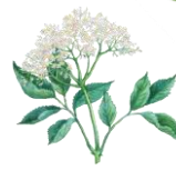
エルダーフラワー (セイヨウニワトコ花エキス)