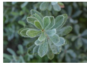
北海道の自社ファームで栽培する、絶滅危惧植物ヤチヤナギを使った化粧品原料は、2003年、メゾンレクシアが日本で初めて ※5 開発

限定品〈ブルーム〉にはさらに、エモリエント効果の高い「ヤチヤナギ葉水 ※3 」も追加。春夏に陥りやすいインナードライ肌を、みずみずしいテクスチャーのクリームで包み込み、生まれたてのようなすこやかな肌へ導きます。