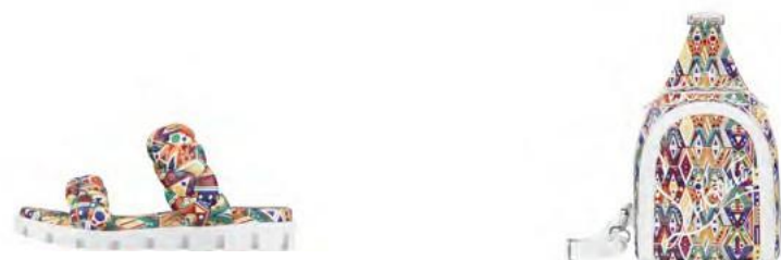
JUST BRIO BRAID