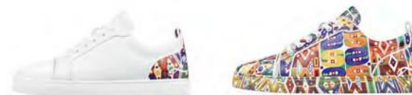
FUN LOUIS JUNIOR

ブレイズの要素は、クリエイティブな3人とその友情を表すシンボルです。また、コレクション全体を統一するテーマとして、Just BrioフラットサンダルやUrbino Moc Braidモカシンなどのデザインにも取り入れられています。