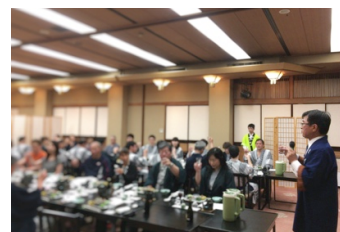
昨年の様子（第2回舞姫）

当イベントは、昨年、当館の創業105周年を記念してスタートいたしました。地元長野県からだけではなく、東京都や神奈川県などの首都圏からもお越しいただき、全5回の開催で161名のお客様の参加があり、大盛況にて終了いたしました。