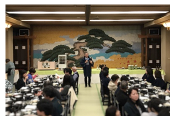
昨年の様子（第5回真澄）

当日は、各蔵元の杜氏や代表から酒蔵の歴史や日本酒の特長を聞きながら、諏訪五蔵の日本酒をお楽しみいただけます。食事は、日本酒と相性の合う、地元諏訪の野菜や食材を使った特別会席料理をご用意いたします。