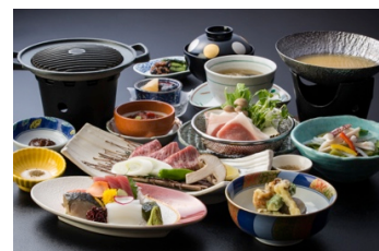
料理写真イメージ

信州 諏訪湖 上諏訪温泉 油屋旅館は、アゴーラ・ホテルアライアンスのビジョンである「美しい日本を集めたホテルアライアンス」のもと、恵まれた立地とスケールメリットを最大限に生かし、地域に貢献できる宿を目指して参ります。