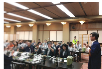
昨年の様子（第2回舞姫）

なお第3回（7月6日）横笛、第4回（9月7日）本金、そして第5回（11月9日）の真澄で最終回となります。