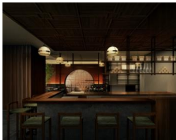
アゴラ 京都四条 レストランイメージ