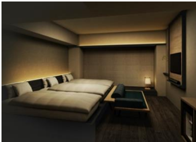
アゴラ 京都四条 客室イメージ

株式会社アゴラ ホスピタリティーズ(本社:東京都港区 代表取締役社長:クホック・ゲイリー・ヤン・クエン、以下アゴラ)は、京都市下京区に開業準備中である、ホテルの名称を「アゴラ 京都四条」(80室)、「アゴラ 京都烏丸」(140室)と決定し、2館同時に2021年4月(予定)開業いたします。それに伴い2020年12月1日(火)にホテルホームページを公開し、また12月15日(火)より、予約の受付を開始いたします。