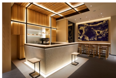
アゴーラ 東京銀座

アゴーラ ホスピタリティーズは、「美しい日本を集めたホテルアライアンス」をビジョンに掲げ、お客様の期待を超える最高の場所を提供するとともに、地域に貢献できる「街の自慢」となるホテル、旅館の創出を目指します。全国で11施設、客室数1,374室を展開。