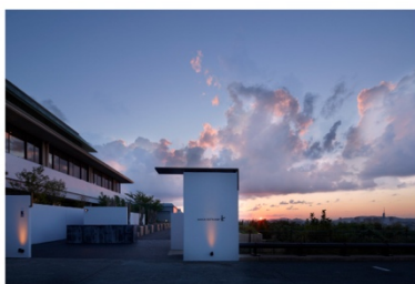
アゴーラ福岡山の上ホテル&スパ