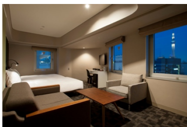
アゴーラプレイス 東京浅草