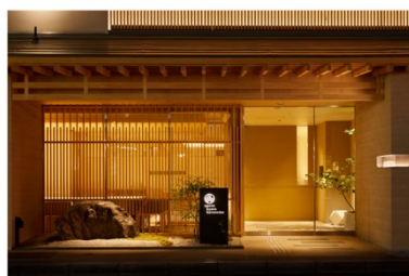
アゴーラ 京都烏丸