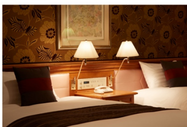
ホテル アゴーラ リージェンシー 大阪堺