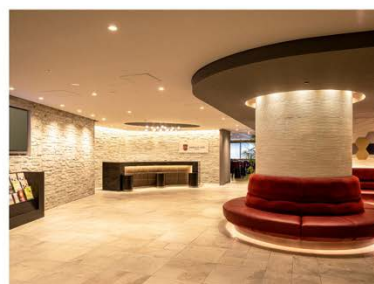
アゴーラプレイス 大阪難波