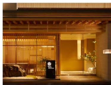
アゴーラ 京都烏丸