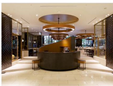
ホテル アゴーラ 大阪守口