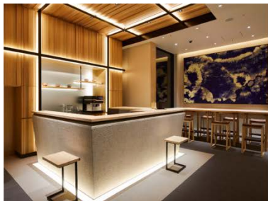
アゴーラ 東京銀座

アゴーラ ホスピタリティーズは、「美しい日本を集めたホテルアライアンス」をビジョンに掲げ、お客様の期待を超える最高の場所を提供するとともに、地域に貢献できる「街の自慢」となるホテル、旅館の創出を目指します。全国で9施設、客室数1,283室を展開。