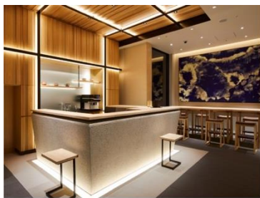
アゴーラ 東京銀座

アゴーラ ホスピタリティーズは、「美しい日本を集めたホテルアライアンス」をビジョンに掲げ、お客様の期待を超える最高の場所を提供するとともに、地域に貢献できる「街の自慢」となるホテル、旅館の創出を目指します。全国で9施設、客室数1,283室を展開。