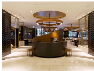
ホテル アゴーラ 大阪守口