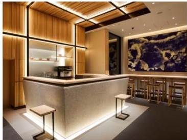
アゴーラ 東京銀座

アゴーラ ホスピタリティーズは、「美しい日本を集めたホテルアライアンス」をビジョンに掲げ、お客様の期待を超える最高の場所を提供するとともに、地域に貢献できる「街の自慢」となるホテルの創出を目指します。全国で9施設、客室数1,283室を展開。