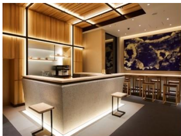
アゴーラ 東京銀座

アゴーラ ホスピタリティーズは、「美しい日本を集めたホテルアライアンス」をビジョンに掲げ、お客様の期待を超える最高の場所を提供するとともに、地域に貢献できる「街の自慢」となるホテルの創出を目指します。全国で9施設、客室数1,283室を展開。