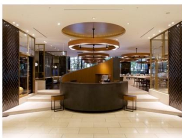
ホテル アゴーラ 大阪守口