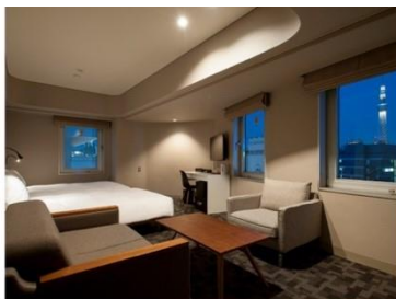
アゴーラブレイス 東京浅草