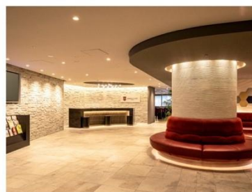
アゴーラブレイス 大阪難波