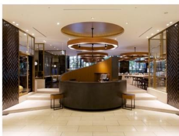
ホテル アゴーラ 大阪守口