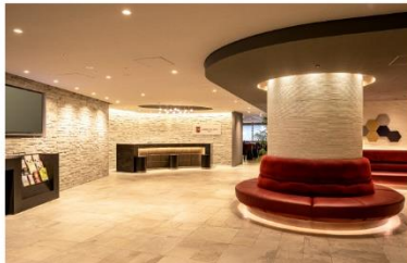
アゴラプラス 大阪難波