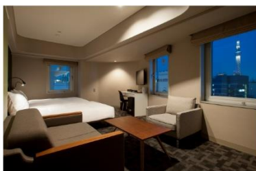
アゴラプラス 東京浅草