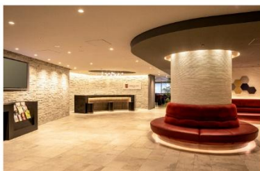
アゴーラプレイス 大阪難波