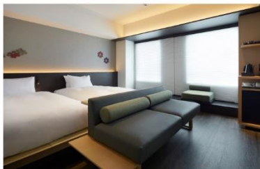
アゴーラ 京都四条