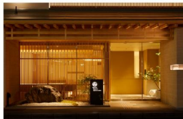
アゴーラ 京都烏丸