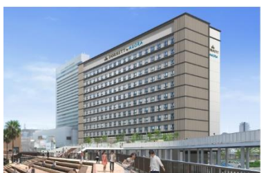
ドーセット バイ アゴーラ 大阪堺 (2025年3月25日開業)