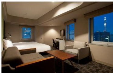
アゴーラプレイス 東京浅草