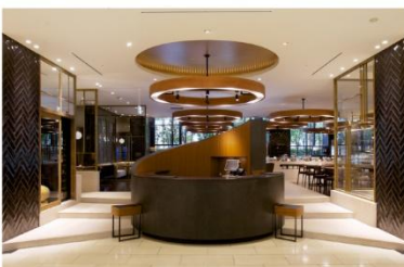
ホテル アゴーラ 大阪守口