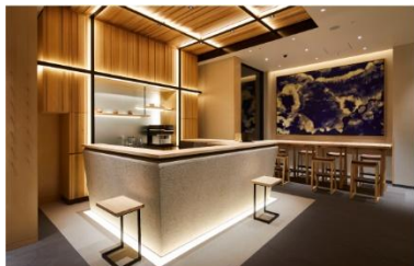
アゴーラ 東京銀座

アゴーラ ホスピタリティーズは、「美しい日本を集めたホテルアライアンス」をビジョンに掲げ、お客様の期待を超える最高の場所を提供するとともに、地域に貢献できる「街の自慢」となるホテルの創出を目指します。全国で9施設、客室数1,283室を展開。