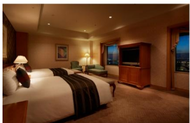
ホテル アゴーラ リージェンシー 大阪堺