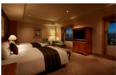
ホテル アゴラ リージェンシー 大阪堺