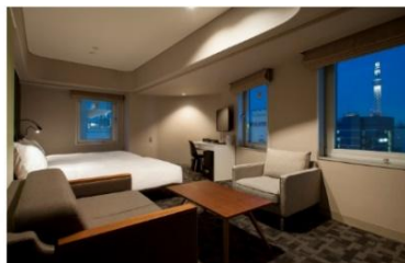
アゴラプレイス 東京浅草