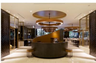
ホテル アゴラ 大阪守口