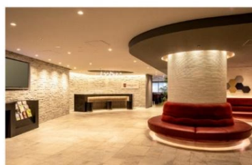
アゴラプレイス 大阪難波