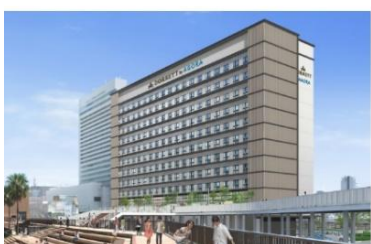
ドーセット バイ アゴラ 大阪堺 (2025年3月25日開業)