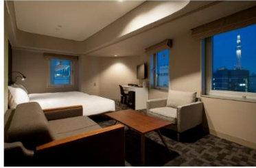
アゴラプレイス 東京浅草