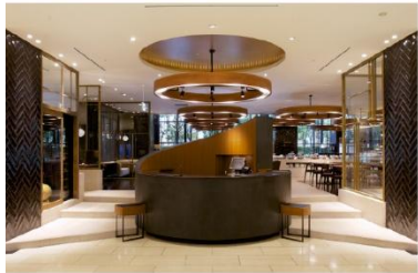
ホテル アゴラ 大阪守口