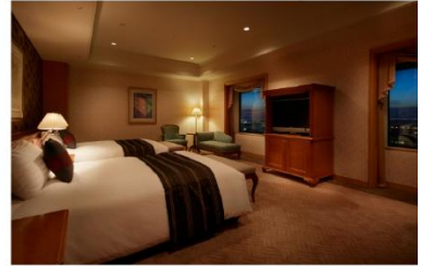
ホテル アゴラ リージェンシー 大阪堺