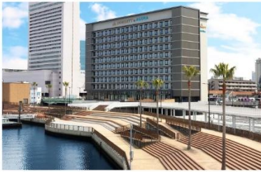
ドーセット バイアゴラ 大阪堺