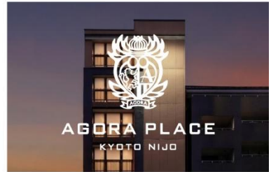
アゴラプレイス 京都二条 (2026年2月16日プレオープン)