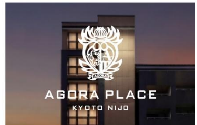
アゴーラプレイス 京都二条