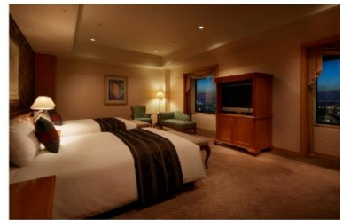
ホテル アゴーラ リージェンシー 大阪堺