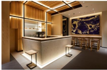
アゴーラ 東京銀座

アゴーラ ホスピタリティーズは、「美しい日本を集めたホテルアライアンス」をビジョンに掲げ、お客様の期待を超える最高の場所を提供するとともに、地域に貢献できる「街の自慢」となるホテルの創出を目指します。全国で9施設、客室数1,260室を展開。