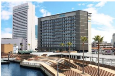
ドーセット バイアゴーラ 大阪堺