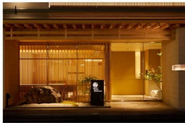
アゴーラ 京都烏丸