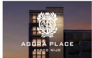
アゴラプレイス 京都二条