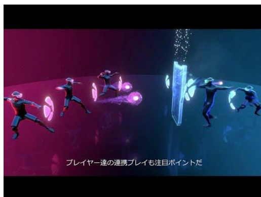
「最先端 AR スポーツ「HADO」」

「HADO」は拡張現実（AR）技術を用いた次世代のスポーツアクティビティです。プレイヤーは専用のヘッドマウントディスプレイとアームセンサーを装着し、自分の腕の動きでエナジーボールを放ったり、シールド（盾）で身を守ったりしながら、対戦相手や仮想モンスターと戦います。激しい動きも可能ですが、座ったままや車椅子でのプレイも可能で、体力や身体状況に関わらず誰もが楽しめるスポーツとして注目されています。この特性により、従来のスポーツでは参加が難しかった方々にも、新たな体験機会を提供できます。