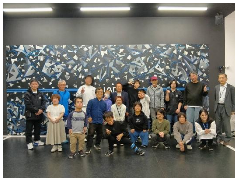
プレイを終えて、みんなで記念撮影

「あまり動き回れない私でも、プレイを存分に楽しむことができました。車椅子の方も参加できますし、もちろん激しく動いて戦うこともできる。それが HADO の魅力です。参加者からも“いい運動になって爽快感が味わえた！”“おもしろかったので、またやりたい！”といった声が寄せられました」