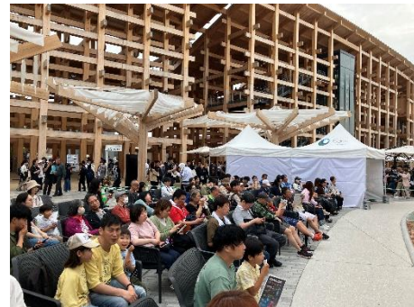
大阪・関西万博イベント時の様子