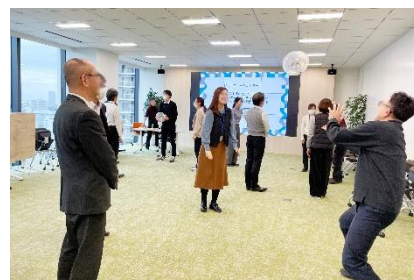
アサーティブコミュニケーションを 取り入れた運動

産業医の指導のもと、座学と運動を組み合わせた実践型プログラムを実施しています。知識と行動の両面から従業員の健康をサポートするとともに、営業所など会場への参加が難しい従業員に向けてオンライン同時配信や後日の動画公開も行い、全社一体で取り組んでいます。