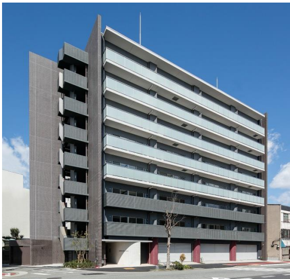
エスペランサ海老江 外観