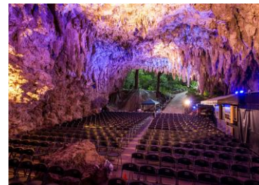
平和への願いと未来への祈り 沖縄 ガンガラーの谷