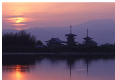
日本の文化はここからはじまった 奈良 法相宗大本山 薬師寺