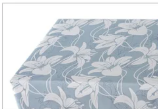
【仏事専用】アクアリリー