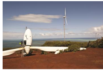
ニューカレドニアの風力発電