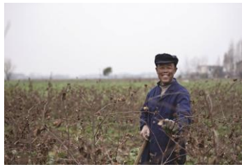
中国のバイオマス発電