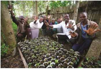
ケニアの森林保全