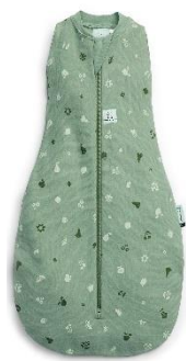
▲フルーツサラダ ▲スイートオーチャード ＜オールシーズン＞ 1.0TOG