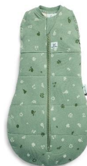
▲フルーツサラダ ▲スイートオーチャード ＜冬向け＞ 2.5TOG