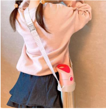
ボトル本体は別売りです

https://bboxforkids.jp/products/bottlecarrier