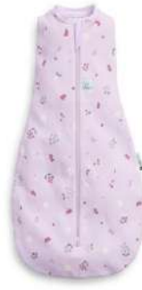
▲バタフライガーデン