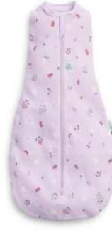
▲バタフライガーデン