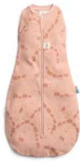
▲エレファントパレード