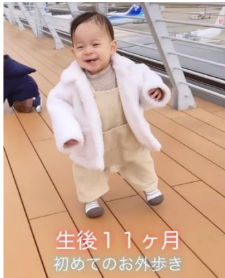
生後11ヶ月 初めてのお外歩き

9ヶ月から歩き始めたのでアティパスを購入し、1ヶ月ほどお家で練習してお外デビューした思い出の日。