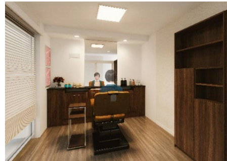
「アデランス横浜関内」 女性用ブース（イメージ図）

「アデランス横浜関内」は、関内駅前北口地区の再開発にともない、真砂町「CERTE ビル」から相生町「関内馬車道 CORK ビル」7 階へ移転します。市営地下鉄「関内」駅から徒歩 2 分、JR「関内」駅から徒歩 5 分と、駅近くの利便性は変わらず、ご来店いただいたお客様に木のぬくもりと落ち着きを感じていただける店内を目指しました。