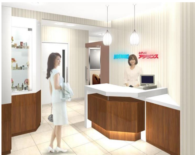
「アデランス山口」（イメージ図）

近年ウィッグをファッションとして楽しむ方が増加しています。「アデランス山口」では、専門のヘアスタイリストが、お客様の魅力を引き出すオーダーメイド・ウィッグ作りをお手伝いいたします。また、毛髪の健康にも着目し、専門的な頭皮のヘアチェックや育毛ケアサービス、ダメージの少ないヘアカラーやパーマ技術を提供いたします。