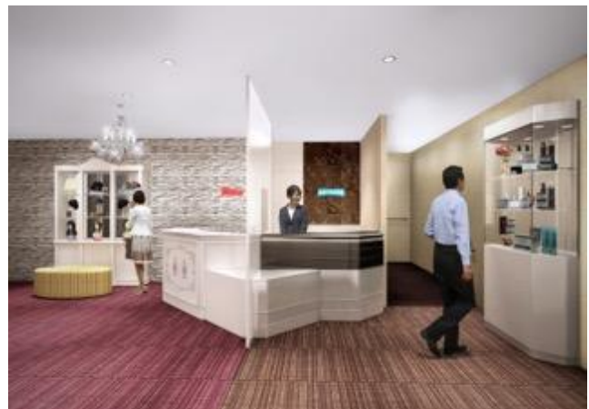
「アデランス浦和」 (イメージ図)