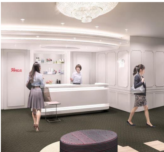
「アデランス池袋」 (イメージ図)

「アデランス浦和」は、浦和駅から埼玉県庁に向かう大通りに面した、駅から徒歩5分の好立地に、移転リニューアルオープンいたします。女性サロンは、高貴で安らぎ豊かな空間に仕上げました。男性サロンは、イタリアンマープルの色合いを主として、力強い空間を表現し、お客様を寛ぎの空間でお迎えいたします。