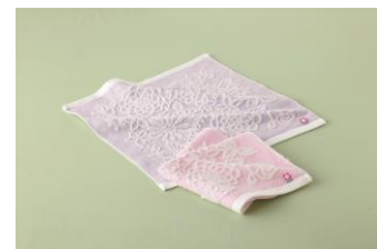
今治 バタフライローズハンドタオル(女性向け)