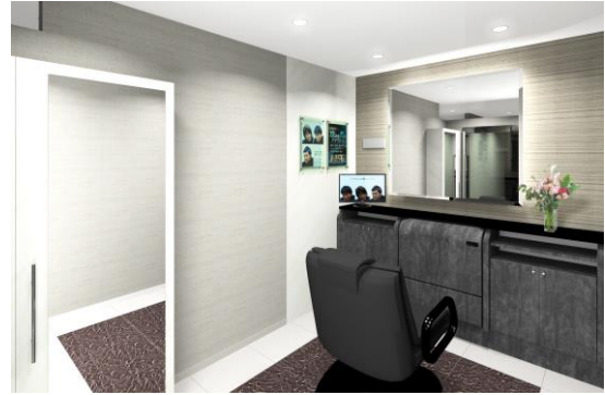
男性サロン（イメージ）

新潟駅は県庁所在地でもある新潟市の中心駅で、新潟都市圏のターミナル駅として県民のみならず県外の方々も利用しています。駅の近くにはアミューズメント施設や大型スーパーなどの商業施設群である「万代シティ」があり、新潟の流行を発信する街として、連日多くの人で賑わいます。「アデランス新潟」は、このような恵まれた立地条件を生かしながら、地域の方々安心してご利用いただける、親しみやすく丁寧なサービスを行ってまいります。