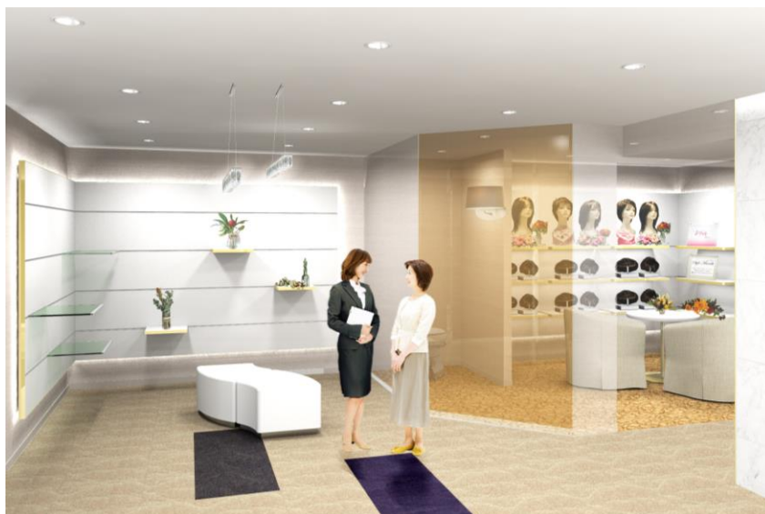
「アデランス新潟」（イメージ図）

カウンセリングルームには大型モニターを設置し、ヘアチェックで頭皮状態等をご確認いただけます。また、全室お客様のプライバシーにも十分配慮した作りで、テレビモニターも設置いたしました。