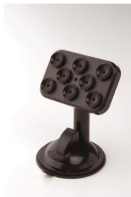
スマホキャッチャー(男性向け)