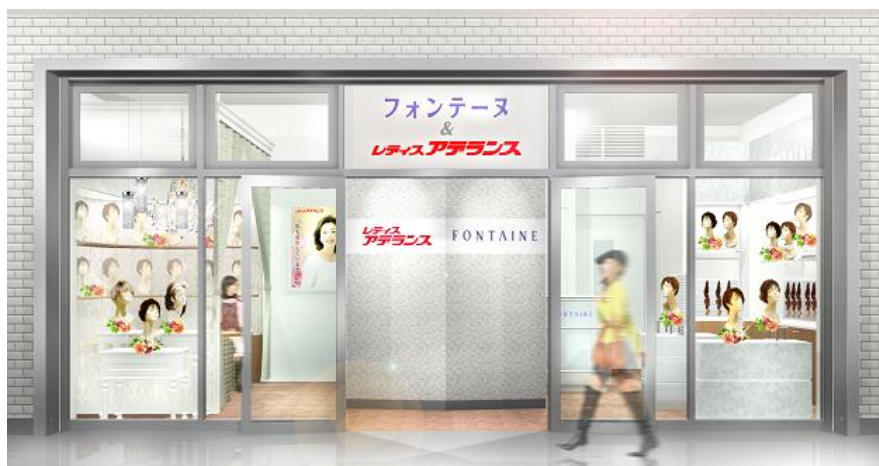
「フォンテーヌ&レディスアデランス たまプラーザ」