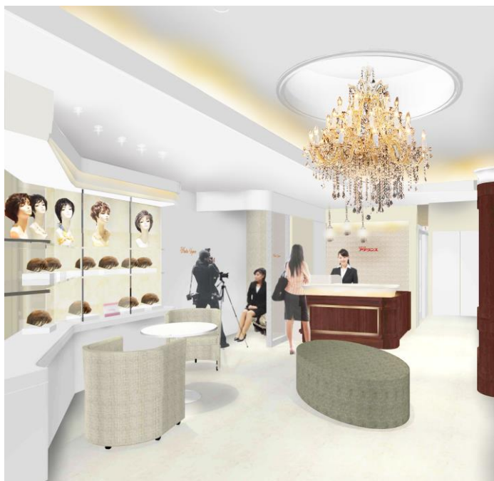
スタイル・ミュージアム&フォトスペース (フォンテーヌ&アデランス沖縄)

アデランスでは、さまざまな髪型をお楽しみいただける「スタイル・ミュージアム」の導入店舗を拡大しています。今回オープンする2店舗にも「スタイル・ミュージアム」を設置しており、ロングヘアやショートヘアなど多彩なスタイルのウィッグを多数展示しています。また、沖縄店には、ストロボなど本格的な撮影機材を装備したフォトスペースもあります。実際にウィッグを試着した姿を、お客様のご要望に応じて一眼レフカメラにて撮影します。