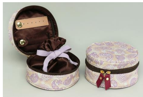
お買い上げプレゼント 「オリジナル ジュエリーポーチ」