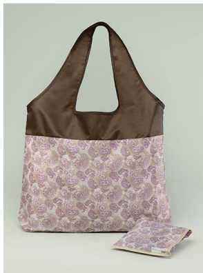
ご試着プレゼント 「オリジナル エコバック」

3 万円（税抜）以上お買い上げのお客様に「オリジナル ジュエリーポーチ」をプレゼントします。（なくなり次第終了）