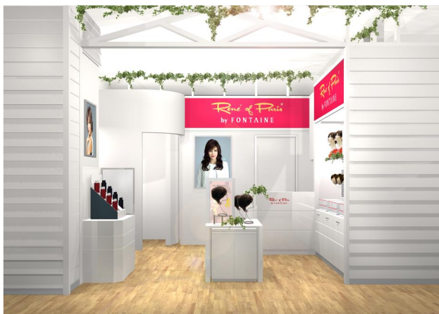
『ルネオブパリス by フォンテーヌ MIプラザ釧路昭和店』 (イメージ図)

釧路市は、北海道の東部、太平洋岸に位置し、「釧路湿原」「阿寒」の二つの国立公園をはじめとする雄大な自然に恵まれた街であり、東北北海道の中核・拠点都市として社会、経済、文化の中心的な機能を担っています。同店舗は、このような立地条件を活かしながら、より多くの地域の方々に安心してご利用いただくためにサービスの向上を図っていきます。