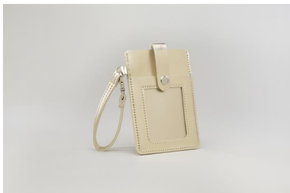
ご試着プレゼント 「オリジナル パスケース」

5 万円（税抜）以上ご購入上げのお客様に「FONTAINE×ROOTOTE オリジナル 巾着トート」をプレゼントします。トートバッグの専門ブランド「ルートート」のフォンテーヌ オリジナルバッグです。（なくなり次第終了）