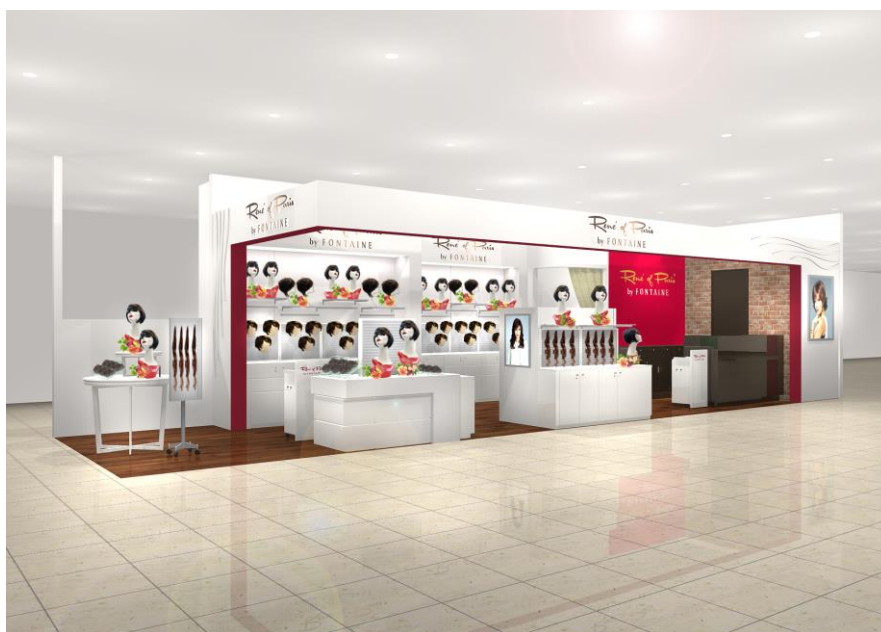
「ルネ オブ パリス by フォンテーヌ 福井エルパ店」 (イメージ図)

今回店舗を出店する「ラブリーパートナーエルパ」は、地域とのふれあいを大切にする福井県最大級のショッピングモールです。ファッション、グルメ、生活雑貨など多彩なフロア構成で、地域の生活拠点として多くの人々が訪れます。同店舗は、このような恵まれた立地条件を活かしながら、日々のコーディネートにプラスするだけで簡単にお洒落を楽しめるウィッグの魅力をお伝えしていきます。