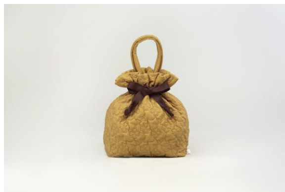
ご購入上げプレゼント 「オリジナル 巾着トート」