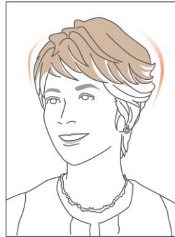
ベースの形が自由に変えられ頭にフィットします

ウィッグのベース部には、フラワーキャッチと呼ばれる、ベースの形が自由に変えられるループ状の部材を採用しており、様々な頭の形に快適にフィットします。また、フラワーキャッチ部には、毛が色々な方向を向くように植えてあり、ベースの間から自髪を引き出し馴染ませることで、より自然なヘアスタイルを実現します。