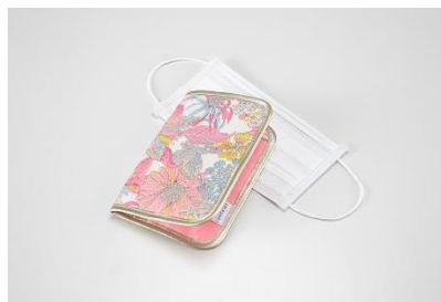
お買い上げプレゼント オリジナル マスクポーチ