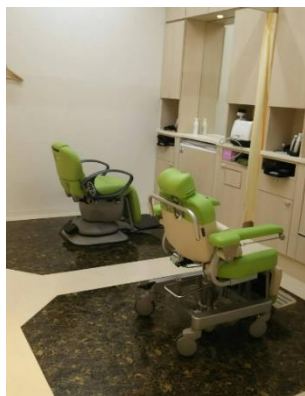
アデランス病院内ヘアサロン

今回、グンゼ社と企業連携を結ぶことにより、患者さまの更なる QOL 向上を目指します。グンゼ社では、健康・医療分野の拡大を目指した「ナイチンゲールプロジェクト」において、QOL 向上のための「メディキュア」ブランド製品を 2016 年より販売し、セルフケア支援を行っています。これまで「メディキュア」ブランドの販売は、電話及びインターネットを通じてのみとなっておりましたが、実際に商品を見たい、触れたいとのご要望を多くの患者さま、医療関係者の方から頂いており、今般、これらのご要望にお応えすべく、当社の病院内ヘアサロンを通じて、直接手に取り、目に触れる形で取扱うこととなりました。今後は、「優良品の提供により社会に貢献する（グンゼ）」、「毛髪関連事業を通じて、笑顔と心豊かな暮らしに貢献する（アデランス社）」という両社の企業理念を共有しながら、事業と連動した CSR 活動として医療機関との連携やセミナーの共催などを計画していきます。