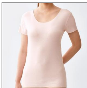
(写真: 2分袖インナー)