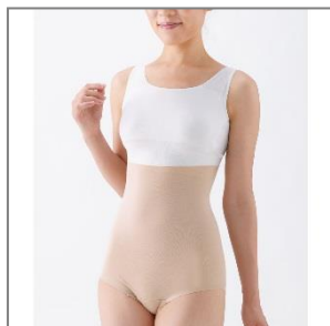
(写真: ハイウエストショーツ)