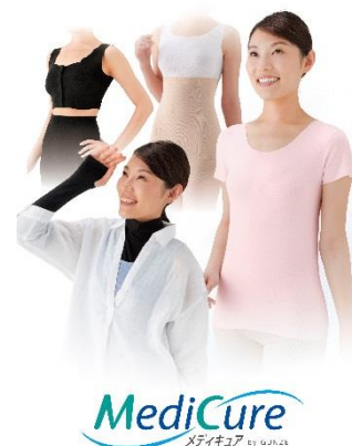
グンゼ メディキュアシリーズ