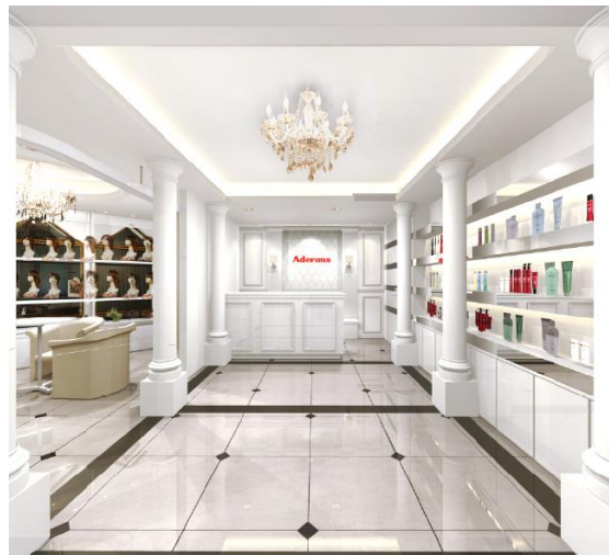
左：店舗入口、右：受付（イメージ）