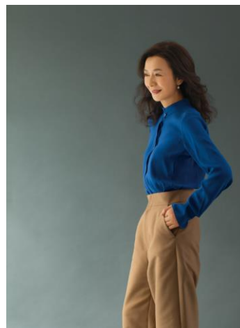
シフォレ ヴィヴィアン リーフレットより