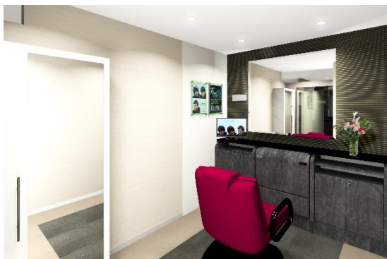
男性用ブース（イメージ図）