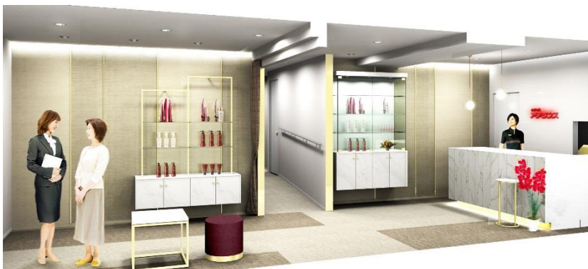
ディスプレイスペースが設置された 女性エントランス（イメージ図）

女性サロンには、近年ウィッグをファッションとして楽しむ女性が増加していることを背景に、フォトスペースを設けました。ロングヘアやショートヘアなど様々なスタイルのウィッグをご試着いただき、一眼レフカメラにて撮影した写真をお持ち帰りいただけます。また、カウンセリングルームには、頭皮の状態をチェックし、お客様にご覧いただきやすいよう大型モニターを設置しました。専門のヘアスタイリストがお客様の魅力を最大限に引き出すオーダーメイド・ウィッグや増毛、育毛などトータルヘアをお手伝いします。また、大学やパートナー企業との共同研究など、毛髪研究から生まれた、機能的なヘア & スカルプケア商品も豊富にラインナップしております。さらに、他社でウィッグを購入したが、スタイルが合わない、カラーが合わない、メンテナンスができないなど、お悩みの方にもアフターメンテナンスを実施しておりますので、お気軽にご相談いただけます。