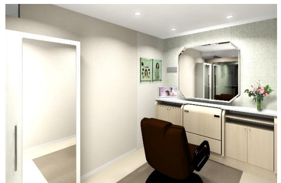
女性用ブース（イメージ図）