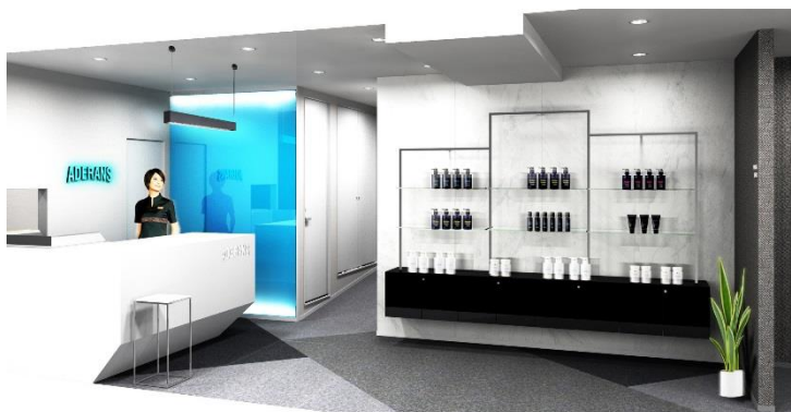
ディスプレイスペースが設置された 男性エントランス（イメージ図）