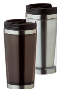
ステンレストンブラー（男性向け）