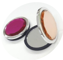
コンパクトジュエルミラー （女性向け）