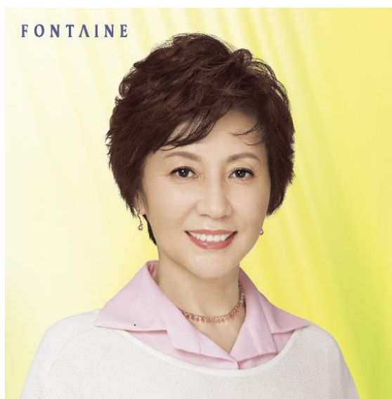
ヴァラン・新作トップピース (T30SP カラー：NF4)

また、「VALAN®」新作ウィッグの発売を記念し、リバティプリントを使用した「ヴァラン30周年記念トップピースケース」をプレゼントするキャンペーンを実施します。