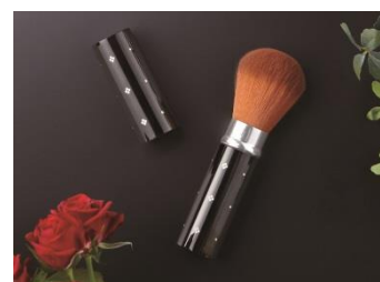
スライドチークブラシ （女性向け）