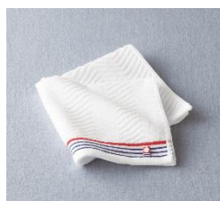
ステンレスタンブラー（左）、 今治 あやなみハンドタオル（右） （男性向け）