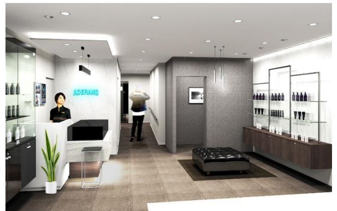
男性用エントランス（イメージ図）