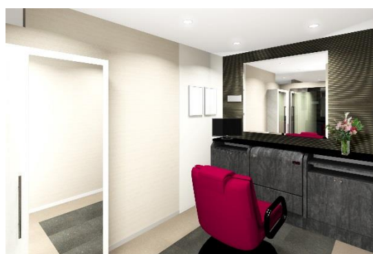
男性用ブース（イメージ図）