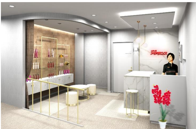
女性用エントランス（イメージ図）

近年ウィッグをファッションとして楽しむ女性が増加していることを背景に、女性フロアにフォトスペースを設けました。ロングヘアやショートヘアなど様々なスタイルのウィッグをご試着いただき、一眼レフカメラにて撮影した写真をお持ち帰りいただけます。また、カウンセリングルームには、頭皮の状態をチェックし、お客様にご覧いただきやすいよう大型モニターを設置しました。専門のヘアスタイリストがお客様の魅力を最大限に引き出すオーダーメイド・ウィッグや増毛、育毛などトータルヘアをお手伝いします。また、大学やパートナー企業との共同研究など、毛髪研究から生まれた、機能的なヘア&スカルプケア商品も豊富にラインナップしております。さらに、他社でウィッグを購入したが、スタイルが合わない、カラーが合わない、メンテナンスができないなど、お悩みの方にもアフターメンテナンスを実施しておりますので、お気軽にご相談いただけます。