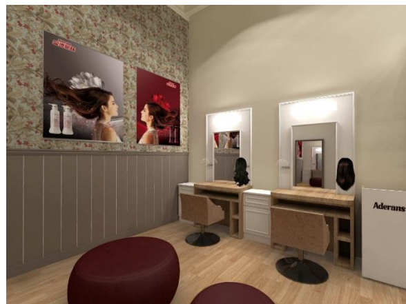
「アデランス台北復興店」(イメージ図)