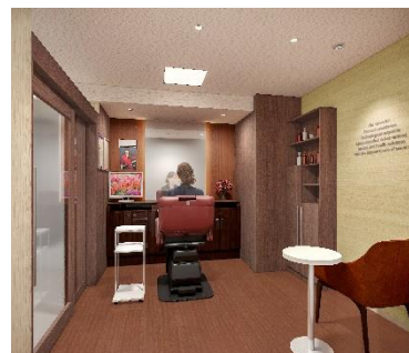
女性用ブース（イメージ図）