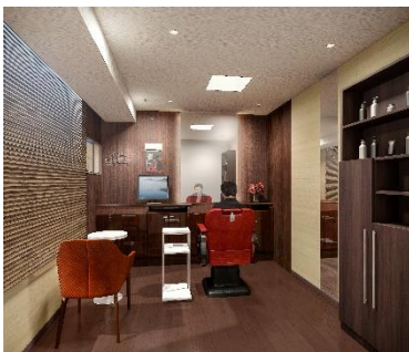
男性用ブース（イメージ図）

さらに、他社でウィッグを購入したが、スタイルが合わない、カラーが合わない、メンテナンスができないなどのお悩みをお持ちの方にも、アフターメンテナンスを実施しております。